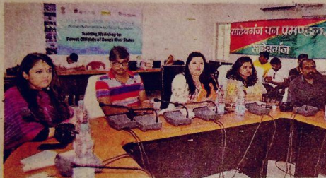
कार्यशाला में उपस्थित पदाधिकारी